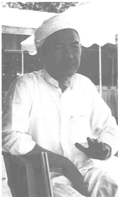
Datuk Tuan Guru Haji Nik Abdul Aziz, Menteri Besar Kelantan Merangkap Marsyidul Am PAS.