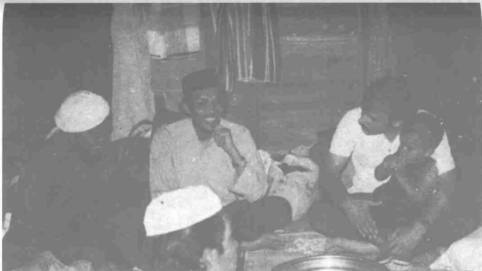
Anwar Ibrahim, suatu ketika dahulu pernah dilemparkan tuduhan ekstrim dan fanatik dalam perjuangannya sewaktu memimpin ABIM dan membantu PAS tetapi kemasukannya ke dalam UMNO telah menghalalkan label tersebut dan kini beliau bersih dari tuduhan-tuduhan seperti itu.