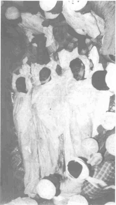
Peristiwa Memali adalah terjemahan dari tuduhan dan label yang dilemparkan oleh pihak Kerajaan terhadap kumpulan Islam kononnya mereka ekstrim dan fanatik. Mereka dibunuh dan sehingga ke hari ini, belum ada apa-apa penjelasan daripada pihak Mahkamah.