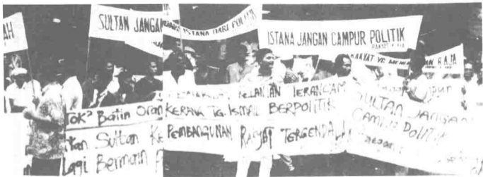
Demonstrasi untuk menjatuhkan Sultan Kelantan adalah petanda bahawa ahli dan penyokong Umno juga taksub dan fanatik terhadap arahan pemimpin mereka. Jika Kelantan menjadi huru-hara, siapakah yang harus dipersalahkan? Pengikut Umno atau