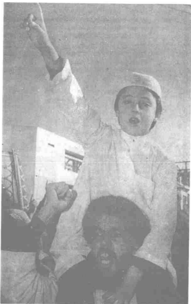
Seorang penyokong kuat Parti Barisan Penyelamat Islam (FIS) mengangkat anaknya dibahu sambil melaung-laungkan slogan 'Pro Islam' di sebatang jalanraya di Algeria. Mereka juga dituduh militan kerana sikap fundamentalis Islam yang diperjuangkan.