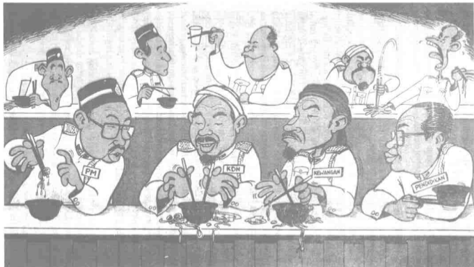
Budaya melabel amat penting digunakan oleh Umno untuk mengurangkan sokongan rakyat khususnya umat Islam terhadap PAS. Sebab itu setiap kali pilihanraya pemimpin PAS seringkali diejek dalam bentuk lukisan-lukisan karton yang mengaibkan.