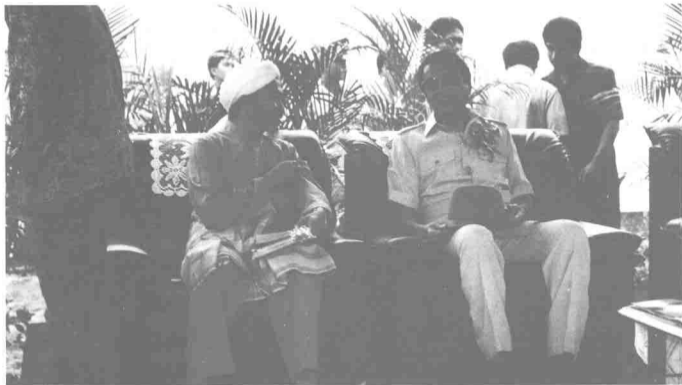
Bukti pemimpin PAS dan pemimpin Umno boleh bersemuka... Bilakah muzakarah Umno-PAS dapat dijalankan demi untuk perpaduan orang Melayu dan umat Islam di negara ini?